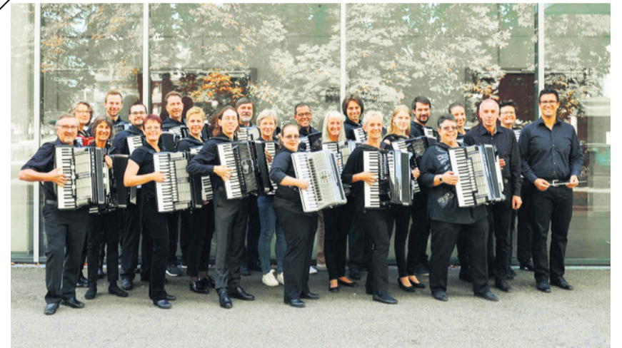
Die Orchester des Handharmonika-Spielrings Möhringen (HSM) präsentieren ein abwechslungsreiches Repertoire für Musikfreunde jedes Alters.

Sie haben auch einen Veranstaltungstipp? Schreiben Sie uns eine E-Mail an freizeit@stzn.de , wir behalten uns eine Auswahl vor. Alle Angaben ohne Gewähr und unter Corona-Vorbehalt.